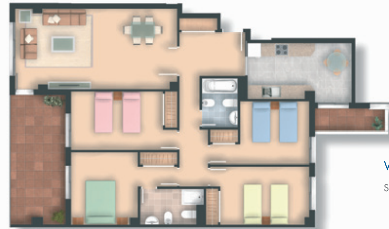
Vivienda de 4 dormitorios